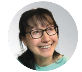
Sylvie FERRARI Économiste, Professeur à l'Université de Bordeaux